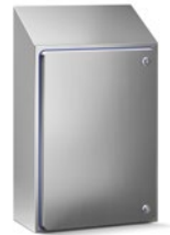
Wandgehäuse mit hygienic-Zertifizierung EKO.HY