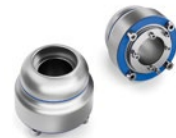
GG21 110 Gelenke