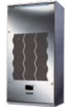
Wand- und Türklimageräte KCVE

* Versandfertig innerhalb von 7 Arbeitstagen.